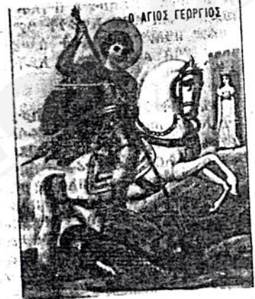
የጸገናት ለባይተን የዐድዋ የደል ሙሴ ፍጡር ረድላት ቅዱስ ጊዮርጊስ

በሃይማኖት ትምህርትና በመጽሐፍ ቅዱስ ታሪክ አገለገለው የመጀመሪያው ጦርነት በዓለም መላእክት በቅዱሳን መላእክትና በሰጥናኤል (ዲያ ብሎስ) ሠራዊት መካከል የተካሄደው ጦርነት ነው። ይህ ረቂቅ ጦርነት በዓይነቱ ምን ያህል ከባድና ፈታኝ እንደነበረ በገላና ሚዛን መገመት ያስቸግ ሬል። የጦር አበጋዞች በእንደ በኩል የመላእክት አለቃ ቅ/ሚካኤል ሲሆን በሌላው ግምብር ሰባት ራሶች፣ ለሥር ቀንዶች ያሉትና በጅራቱ ሲሆውን እጅ የሰማይ ከዋክብት ጦርነት ለመቆር እንደሚች ችላ የተጻፈለት ግዙፍ አውራ ዲያብሎስ ነበር፣ በዚህ ጦርነት የእግዚአብሔር ልጆችና የከፋ መን ተከታዎች በእምነትና በከህደት ጉራ ተለይ