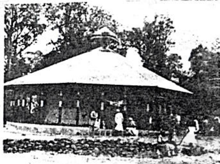
ገንታዊቷ የወንበር ማርያም ቤተ ክርስቲያን

ተአምር እጅግ በጣም እንደናደገቅና የነበረገን ጠን ካራ እምነት ይበልጥ እንደናገለገለው ረድተናል ። በዚህ በተገኘው ዕቃ በመመራት ለባዕን ለመያዝ ብዙም ጊዜ አልፎም ሕዝቡን ሰብስቦን ይህ ዕቃ የማን እንደሆነ የምታውቁ አጋልጡ ሲባል በሙሉ ከተጠርጣሪ ገብር አበርቼ ጋር እመቤታችን አሥር ይዛው ኖሮ ወዲያው ተያዘ ፣ ገብር አበርቼ ይሆናሉ ከተባሉት ይህም ጋር በድምጽ ፎ ስምት ዘወረዳው ፖሊስ ጣቢያ ታሥረው በምርመራ ላይ ይገኛሉ ። የጠፋውም ስንክሳር በአዲስ አበባ ከተማ ሌባው ሊሸጥ በመዋዋል ላይ እንዳለ እጅ ከፍ ገኜ ተይዞ በም/ ሸዋ ፖሊስ ቁጥጥር ሥር ይገኛል ።