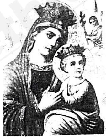
ገብረ ጋዳል ቅድስት/ር/ ማርያም

ወቅት ሰዓቱ ስዓት ነበር ። የእመቤታችን የቅድስት ድንግል ማርያምና አብር በድርብ የነበረ የአቡነ ገብረ መንፈስ ቅዱስ ዕላቶች መሠረታቸው ለሕዝቡ ሲገለጽለት እናታቸው እንደሞተችባቸው ሕጻናት ሕዝቡ በእንባ ተራራ ፣ ወዲያም በአካባቢው ፍልጋውን ተያያዘው ፣ በዚህ ጊዜ ነበር አንድ እስደ ናቂ ተአምር የተከሰተው ፣ በፍለጋ ከተሰማሩት ምእመናን ውስጥ አንድ የገጂ ዓመት ወጣት ከቤተ ክርስቲያን በስተምሥራቅ በኩል በግምት አንድ ኪሎ ሜትር ርቀት ላይ እንደ በመጋረጃ የተጠቀለለ ሣጥን ተጥሎ ያገኛል ። ወዲያው ይህ ደግሞ ምንድን ነው ብሎ ከገደቦቹ ጋር ለግንግት ጠጋ ብሎ እጅን ሲዘረጋ እጅ ጥምልምል ይላል ፣ ሰውነቱም ዝልፍ ልፍ ይልበታል ። አብረውት የነበሩትም እንደዚህ ይሆናሉ ። ለካስ የድንግል ማርያም ጽላት ናራል ወዲያው ካህን ተጠርቶ ቤታይ ሁለቱም ጽላቶች እንደነበሩ በሣጥኑ ውስጥ ተገኙ ፣ ሌላው ደግሞ የሚ ያስደንቀው የሌባው ልዩ ዕቃ ዘወትር በእጅ ይዘት ይታይ የነበረው ከጽላቶቹ ጎን አብር ወርቅ መገኘት የእመቤታችንንና የአቡነ ገብረ መንፈስ ቅዱስን