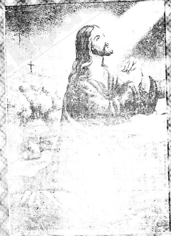
« ደግሞ እርሳዎን ወዳላተ ወሰርሱዎን ስላሉ ስላሉ ይደገቡ »

ደግሞ ዓመታት ሙሉ ለሀላ ውኃ ያላቀመሱት አድቅ የመንበር ግርጭም አበደናቂ ተአምር ዐድዋና ቅዱስ ጊዮርጊስ የቅዱስ ጊዮርጊስ ግዛኦት ፅዕር አበራ