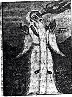
ላቲን ግድብ ላላ ወገን ለሰጠው ጸድቆ ለሰጠው ገብር መንፈስ ቅዱስ

ሥተው ከእናታቸው ላይ ወርደው ለእግዚአብሔር ሦስት ጊዜ ሰገዱ ምስጋናም አቀረቡ ።